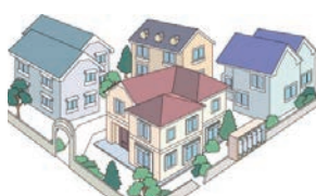
集団供給のお客様